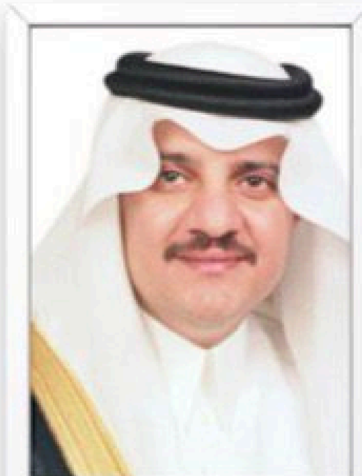
صاحب السمو الملكي الأمير سعود بن نايف حفظه الله أمير المنطقة الشرقية