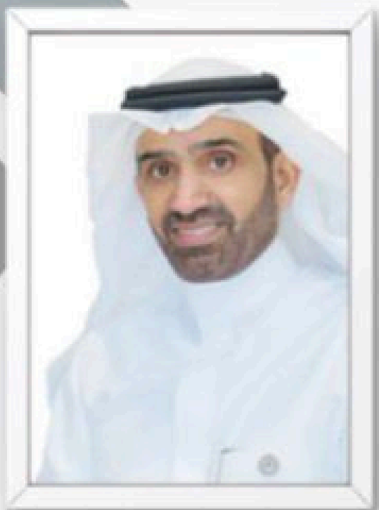
معالي وزير الموارد البشرية و التنمية الاجتماعية المهندس احمد الراجحي