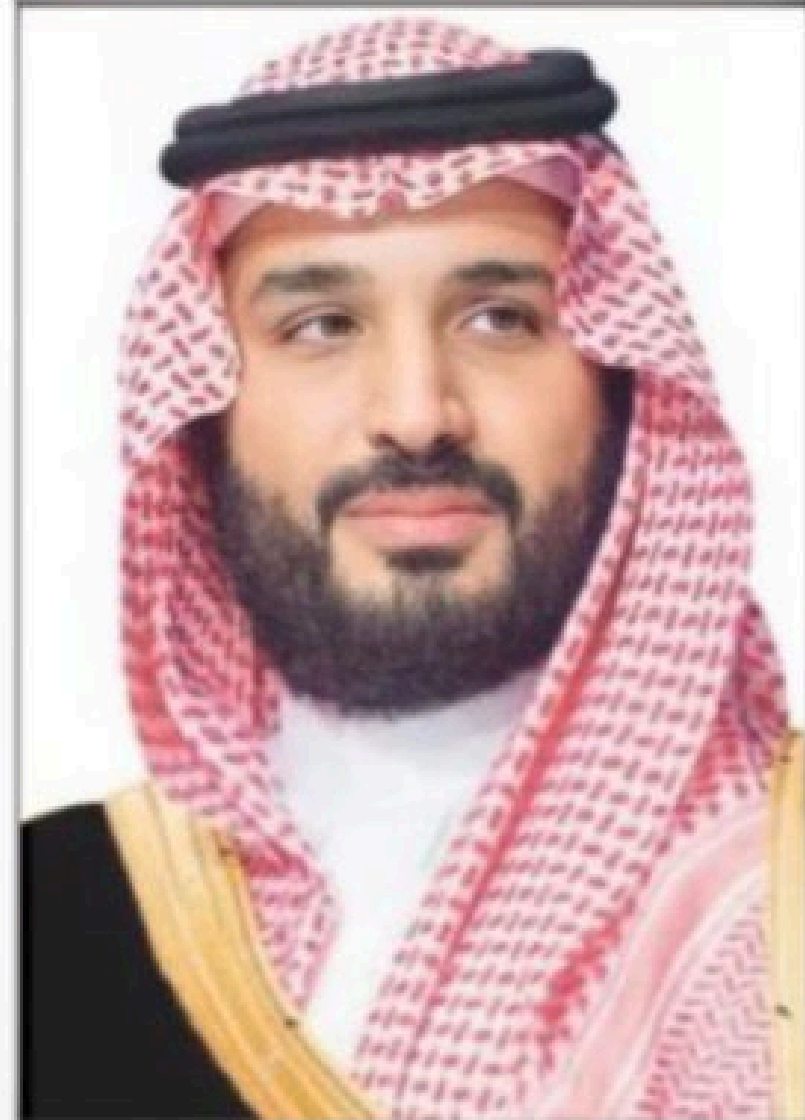
صاحب السمو الملكي الأمير محمد بن سلمان ولي العهد ورئيس مجلس الوزراء حفظه الله