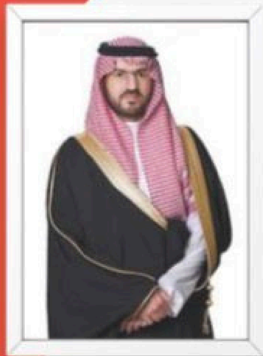
صاحب السمو الملكي الأمير سعود بن بندر حفظه الله نائب أمير الشرقية