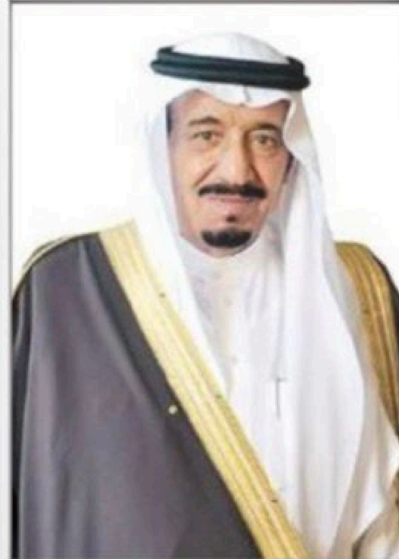
خادم الحرمين الشريفين الملك سلمان بن عبدالعزيز حفظه الله